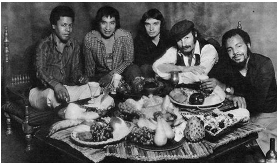
Weather Report : Wayne Shorter, Alex Acuña, Jaco Pastorius, Joe Zawinul e Chester Thompson

Sobre finais da década de 1960 e comezos de 1970 o jazz atópase nunha etapa que os propios grandes do jazz da época califican de confusa o que ocasiona o desánimo en moitos sen saber cara que rumbo vai o barco. Realmente co término jazz-rock nos estamos referindo a todas as variantes do jazz da época, que en maior ou menor medida experimentan un proceso de fusión , polo que moitos críticos prefiren falar de jazz rock fusion ou de fussion . Nesta etapa hai que resaltar a innovación e influencia do grupo Weather Report , formado por jazzman de renome como Joe Zawinul , Wayne Shorter , Alex Acuña , Jaco Pastorius e Chester Thompson . Destacan tamén intérpretes como Chick Corea , Keith Jarret , Miles Davis , Herbie Hancock , Ornette Coleman , Cecil Taylor , a Mahavishnu Orchestra , John McLaughlin , etc..