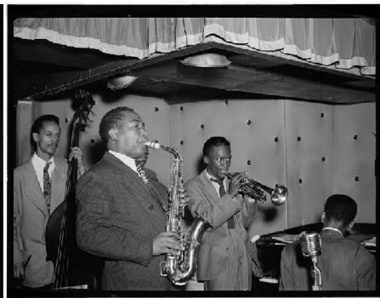
Charlie Parker e Miles Davis