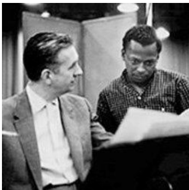
Gil Evans e Miles Davis

Musicalmente, o cool alonxábase da improvisación total e dos furiosos ritmos do be bop , era un estilo máis relaxado e orquestral que daba maior importancia ós arranxos. Tivo moitísimo éxito entre os músicos da costa oeste dos Estados Unidos, polo que tamén se denominou como West Coast Jazz e fíxose moi popular entre a xeración de novos músicos brancos, como Chet Baker e Stan Getz . Outros importantes músicos do cool foron Lennie Tristano , Dave Brubeck e Art Pepper .