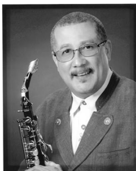
Paquito d ´Rivera